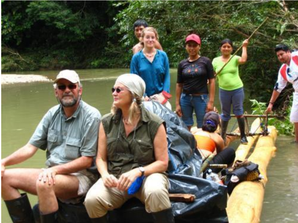
Figura No. 1

Además Turismo Comunitario significa Turismo Responsable, en el respecto del medio ambiente y de la sensibilidad de la Comunidad huésped. Para ayudar al visitante a mantener un comportamiento responsable, se ha desarrollado el siguiente código de conducta, publicado en el Manual de Calidad del Turismo Comunitario del Ecuador.