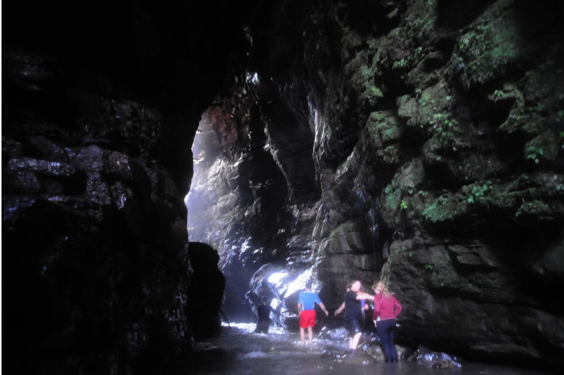
Figura No. 3

se deduce que la cueva fue poblada del 400 a.C. al 800 a.C. testigo de ello son las piezas de cerámica y concha espóndilus encontradas en el lugar. (Álvarez, 2013)