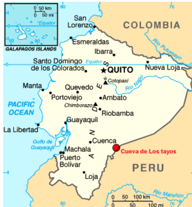
Figura No. 4

Ubicación en mapa del Ecuador (Cuevas de Los Tayos)