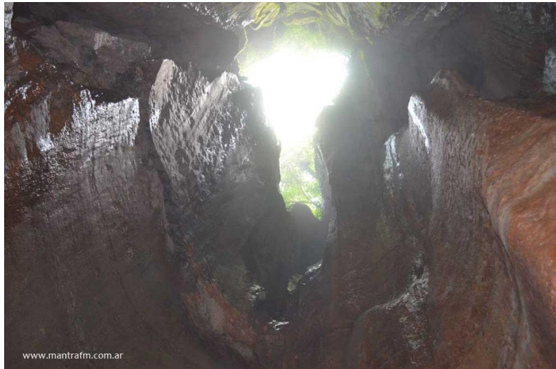
Figura No. 2

hasta la afirmación de los nativos que en la cueva hay huellas gigantes de los hombres de los cielos. (Álvarez, 2013).