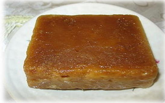
Figura 4. Componentes de la Panela

Según la publicación de (Salazar, 2012) publica que la panela tiene muchos nutrientes beneficiosos para las personas, entre los grupos de nutrientes esenciales de la panela deben mencionarse el agua, los carbohidratos, los minerales, las proteínas, las vitaminas y las grasas. el azúcar que contiene la panela son nutrientes energéticos, las personas con estos nutrientes, su organismo obtiene la energía necesaria para su funcionamiento beneficiosos para el desarrollo de su metabolismo, se dice que los beneficios médicos de la panela es cicatrizante, a pesar que no hay una afirmación científica, para consolidar esta información, los azúcares como la glucosa y la fructuosa; Los cuales poseen un mayor, valor biológico para el organismo que la sacarosa, componente principal que constituye la panela.