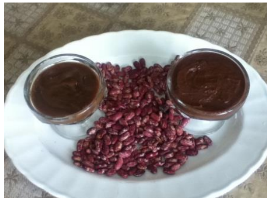
Figura No. 3 Mermelada de Fréjol.

La mermelada de fréjol, está compuesta por el fréjol, panela, preservantes, la composición de estos elementos dan como resultado un producto exquisito y fortificante para la buena alimentación de las personas. Esta mermelada está dirigida en especial para los niños y adolescentes en etapa de desarrollo o crecimiento, ya que el fréjol tiene muchos beneficios alimenticios, lo más importante es rico en vitaminas y fibra, tiene un sabor muy peculiar, los elementos que la conforman son de gran utilidad para la salud del ser humano.