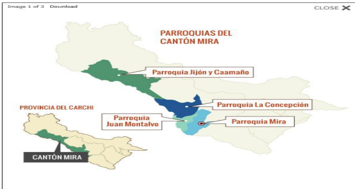
Figura No. 1