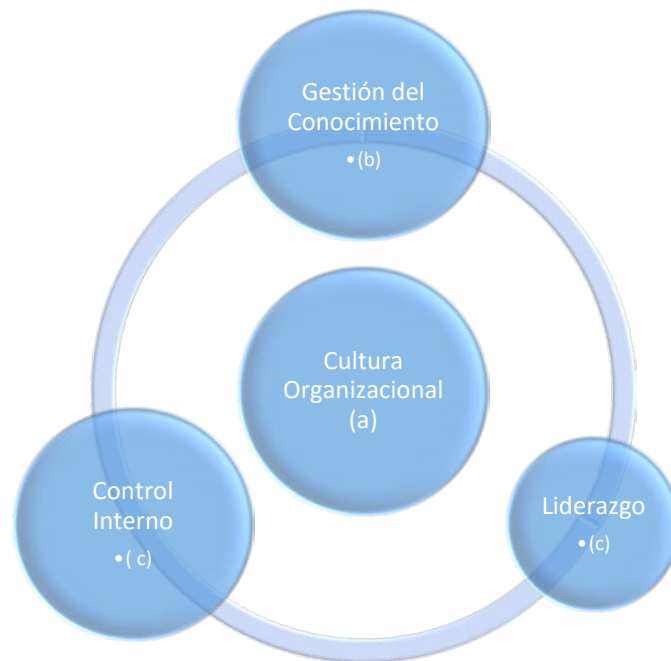
Fig. 1. Cultura Organizacional y su efecto en Gestión del Conocimiento, Liderazgo y el Control Interno. (a) (Trompenaars & Hampden-Turner, 2011). (b) (Schein, 2010) (c) (Castells, 2011) (d) (Northouse, 2015)

La Fig. 2 ilustra la dinámica en relación con el número de citas recibido para los artículos más citados de cada dominio.