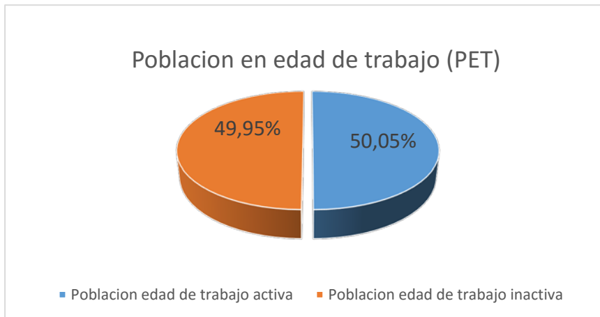
Gráfico N°1 Población de edad de trabajo.

De las personas que trabajan en la Provincia de Los Ríos, el mayor porcentaje pertenece a la categoría de “empleado o asalariado” con el 39,40%; como “cuenta propia” está con el 35,7%; en menor proporción se encuentra el “patrono o socio activo” con el 9,60%; el “trabajador familiar sin remuneración” con el 5% y el “trabajador nuevo” con el 0,50%.